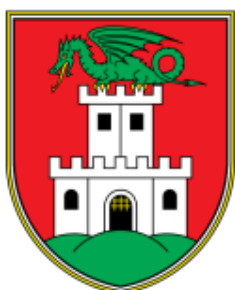
MESTNA OBČINA LJUBLJANA

EVROPSKA UNIJA KOHEZIJSKI SKLAD NALOŽBA V VAŠO PRIHODNOST