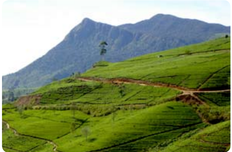
Plantaze čaja v Osrednjem višavju so vse do 2000 m nadmorske višine. Šri Lanka je tretja na svetu po proizvodnji čaja, ki je najpomembnejše izvozno blago. V deželo so ga v 19. st. prinesli Angleži, ko je pred tem bolezen popolnoma uničila vse plantaže kave.