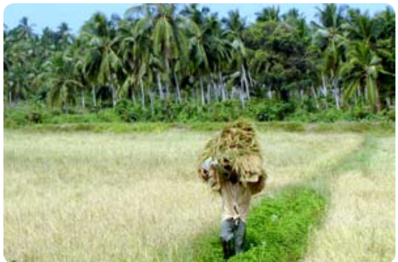
Žetev riža, ki je glavna hrana prebivalstva in ga pridelajo skoraj dovolj za domačo porabo.