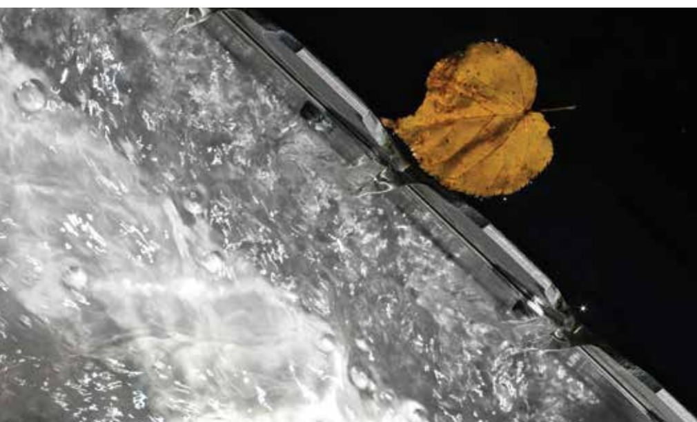
Izток očiščene odpadne vode iz komunalne čistilne naprave.