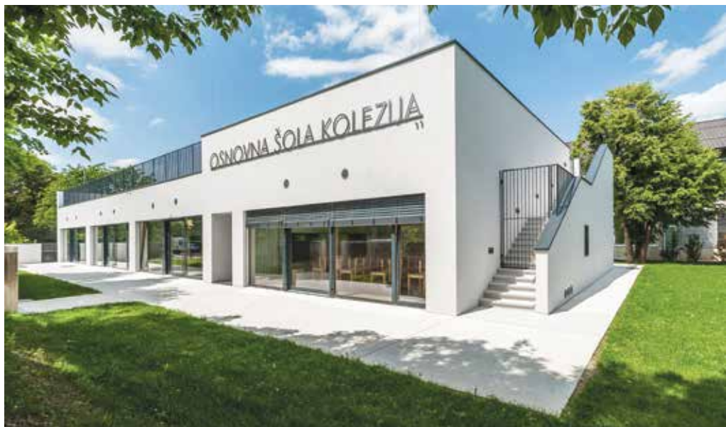
Učence OŠ Kolezija je pričakala prenovljena šola.