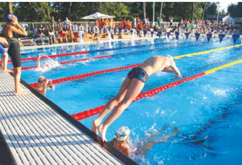
Kolezija, dom ljubljanskih plavalcev.