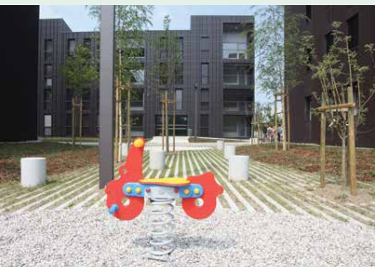
Soseska Polje III je prijazna tudi do otrok.

Projekt so financirali Mestna občina Ljubljana, Ministrstvo za kulturo RS in Evropski sklad za regionalni razvoj.