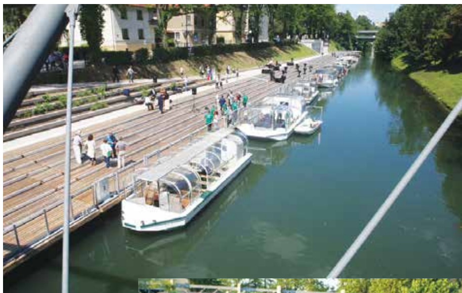
Nova podoba Gruberjevega prekopa vabi na vožnjo po Ljubljani.

Vodeni ogledi za največ sedem oseb bodo organizirani vsako polno uro od 10. do 17. ure.