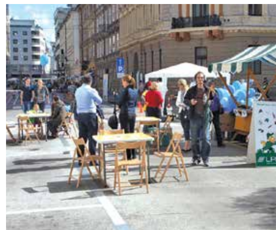
Pridružite se nam!

V sodelovanju z zunanjimi organizacijami, društvi, šolami, vrtci in zainteresiranimi skupinami bomo pripravili ulični festival na Eipprovi in Kolodvorski ulici, kjer nameravamo v prihodnje spremeniti prometni režim za boljše kakovost bivanja. Pripravljamo množični plesni dogodek Diham ples, likovne delavnice za otroke, kolesarski krog za šole, OVIRANTlon poligon z ovirami, nagradne igre, med njimi zaključek kolesarske akcije Pripelji srečo v službo, okroglo mizo o elektromobilnosti, sreča-