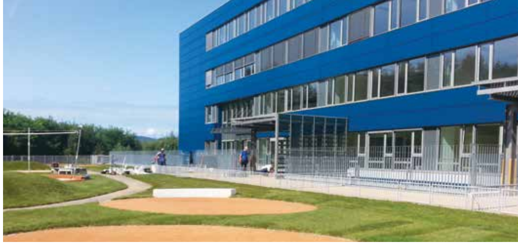
Vrtec v Tehnološkem parku.

Številčne generacije otrok, ki so v zadnjih letih obiskovale vrtece, se zdaj selijo v šole. Na omenjenem oddelku z različnimi ukrepi zagotavljajo prostor za vse. Tako na primer nekdanje prazne šolske prostore, ki so jih v preteklih letih namenili predšolskim otrokom, zdaj ponovno prilagajajo učencem, spet drugje pa so z notranjimi preureditvami pridobili dodatne učilnice.