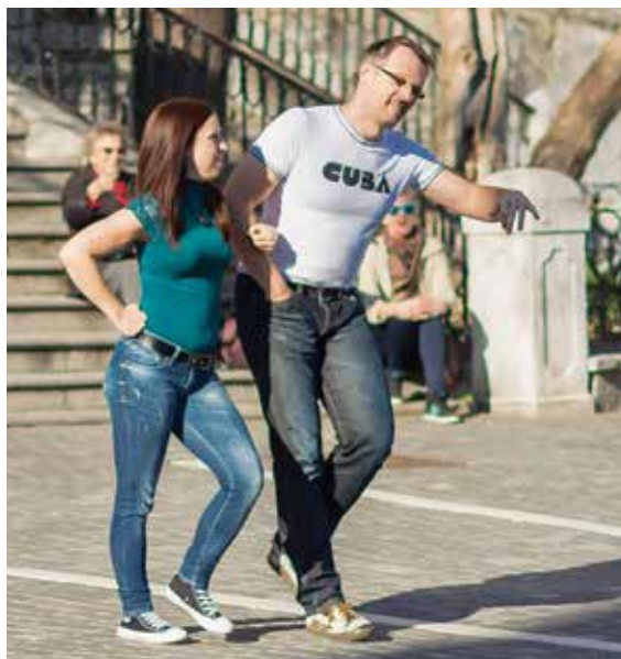
S plesnimi koraki po mestu.

Že naslov vse pove: predstavljamo sodelavca iz Energetike Ljubljana, ki zna mnogo stvari, še več pa je aktivnosti, s katerimi se ukvarja ... Je strojni inženir z magisterijem iz ekonomije, poučuje tako ali drugače, je plesalec po duši z lastno plesno šolo. Predava tudi na Gea Collegeu. Včasih spušča zmaje ... Predvsem pa je očka. Je pa tudi ta, ki mu rečejo: "Človek, ti računalnik razumeš!"