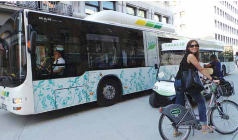
Trajnostna mobilnost

Številni sodelavci, ki so v projektu prenovali v neprestanem dogovarjanju in iskanju najboljših rešitev so sodelavci iz Kabineta župana, Oddelka za urejanje prostora, Oddelka za gospodarske dejavnosti in promet, Ljubljanskega potniškega prometa, JP Vodovod-Kanalizacija, Energetike Ljubljana in drugih oddelkov. Projekt Slovenska cesta torej ni le »zelen« projekt, je tudi projekt »sodelovanja«.