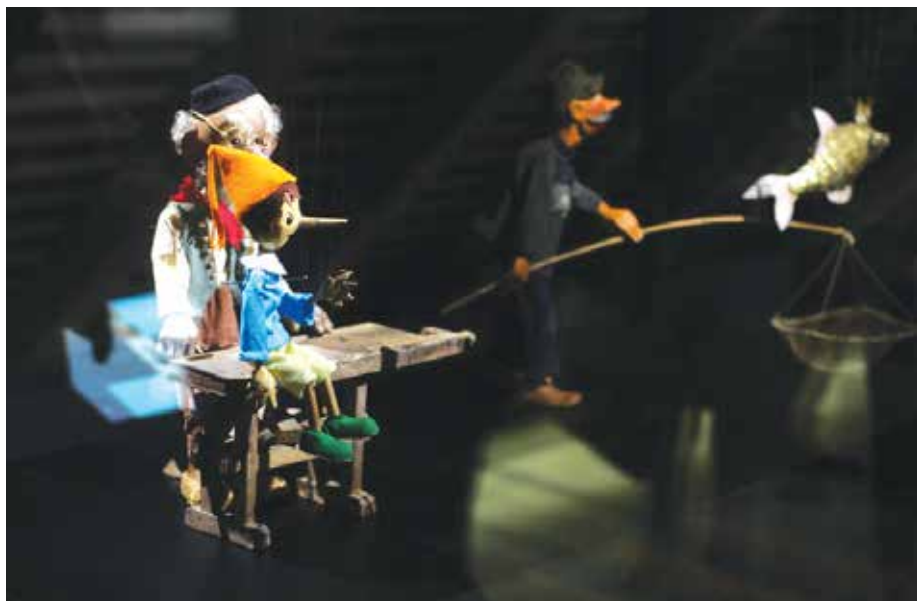
Zgodovina slovenskega lutkarstva na enem mestu.

Dobrodošli na zanimivem in raznolikem lutkovnem popotovanju nad mestom!