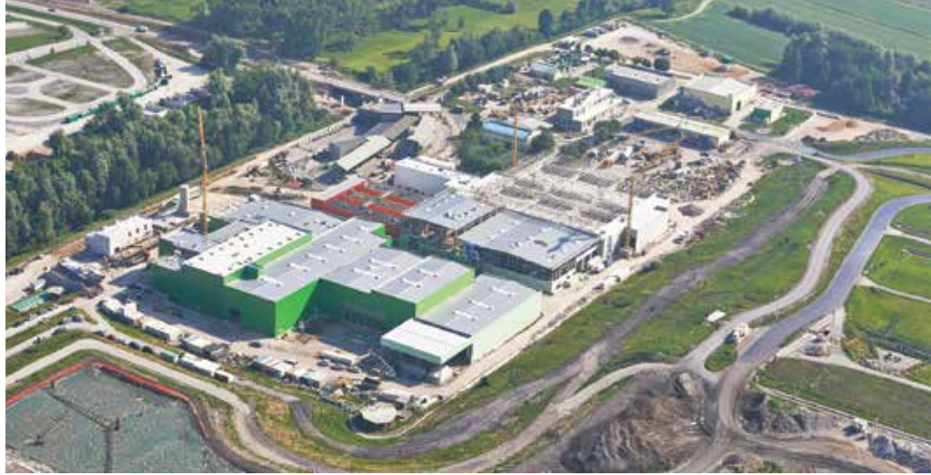
Poleg treh objektov, v katerih bo potekala mehansko-biološka obdelava odpadkov, sta bila zgrajena tudi novo odlagalno polje in čistilna naprava za izcedne vode.

RCERO Ljubljana s poskusnim obratovanjem začne konec letošnjega leta. Gradnja najpomembnejših objektov, tistih za mehansko-biološko obdelavo odpadkov (MBO), se približuje koncu. Vanje vgrajujemo strojne in električne napeljave, postavljamo jeklene konstrukcije in nameščamo glavno procesno opremo.