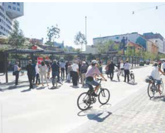
Postajališča osrednjega dela Slovenske ceste so v okviru naziva Ljubljana, Zelena prestolnica Evrope 2016 opremljena s tehnologijo in prikazovalniki, ki imajo zaradi nizke porabe energije minimalen vpliv na okolje. Napaja jih lahko sončna energija, kar omogoča zeleno digitalizacijo mest.

Na začetku septembra je na prenovljenem osrednjem delu Slovenske ceste poskusno začela veljati nova prometna ureditev. Pešcem in kolesarjem so se ponovno pridružili nekateri avtobusi mestnega potniškega prometa in vozila z dovolilnicami MOL za Slovensko cesto. Hitrost je omejena na 30 kilometrov na uro. Poskusno obdobje bo trajalo do konca leta 2015.