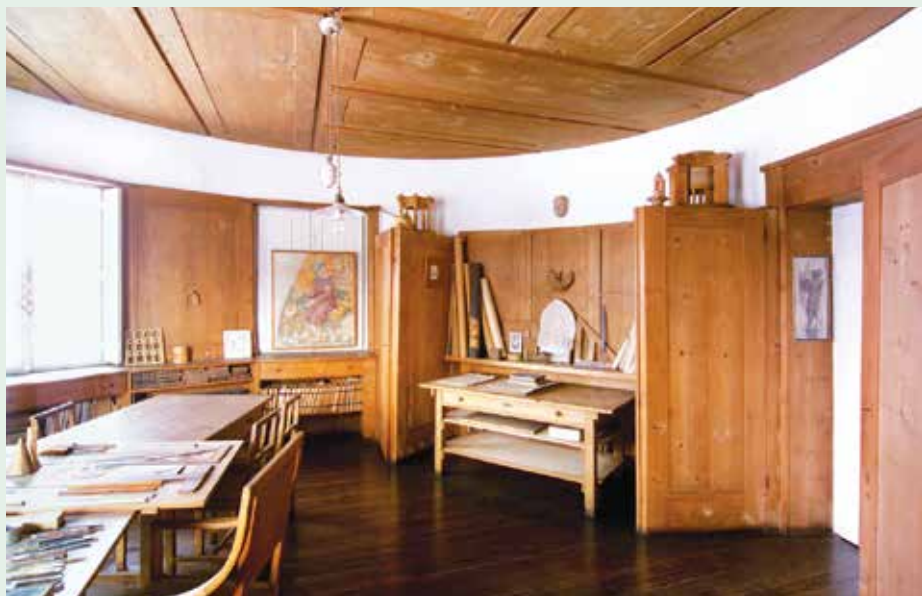
Plečnikova hiša je ena redkih izvorno zasnovanih in opremljenih hiš umetnikov na svetu.

Plečnikova hiša bo odprta od torika do nedelje, od 10. do 18. ure.