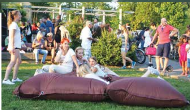
Špica je priljubljeno zbirališče vseh generacij meščank in meščanov ter obiskovalcev našega lepega mesta.