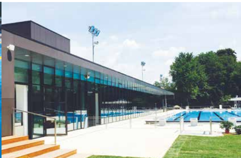
Vabljeni na Kolezijo, mesto, kjer bomo pisali nove spomine.