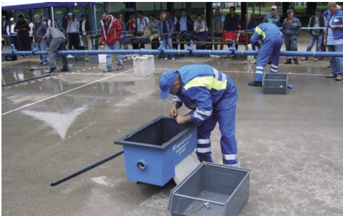
Zmagovalci iz VO-KA v akciji.

skupni razvrstitvi na 28. mestu, ekipa Parkirišč pa na 38. mestu. Naša podjetja so v posameznih tekmovalnih disciplinah osvojila štiri prva in pet drugih mest ter eno tretje mesto. Zlati so bili fantje iz LPP v vlečenju vrvi, ekipa Snage v delovnem tekmovanju odvoza smeti, ekipa VO-KA pa je bila najboljša kar dvakrat, in sicer v kategoriji kanalizacija ter v balinanju. Tudi dvojno srebro in bron jim nista ušla - prvega so si priborili v kegljanju (ekipa LPP je v tej kategoriji zasedla prav tako odlično 5. mesto) ter v kategoriji vodovod, drugega pa v košarki. Srebrni so bili tudi balinarji in košarkaši iz LPP ter ekipa Snage v malem nogometu, kjer so se odrezali tudi člani ekipe Parkirišč, ki je v malem nogometu osvojila 4. mesto.