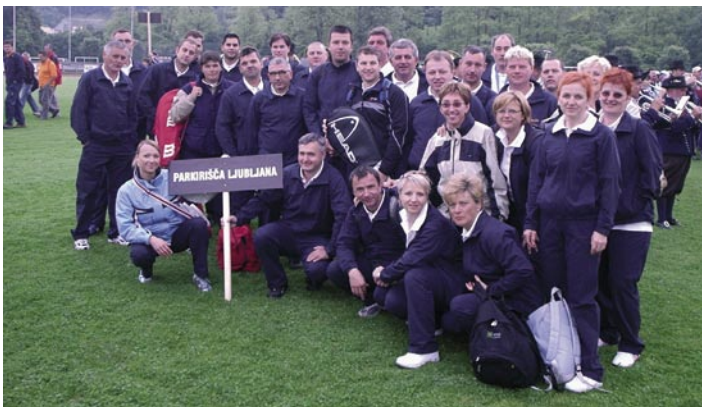
Ekipa Parkirišč v polni postavi.