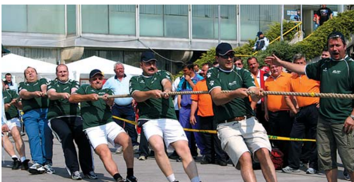
Ekipe LPP-ja je zasedla odlično drugo mesto.