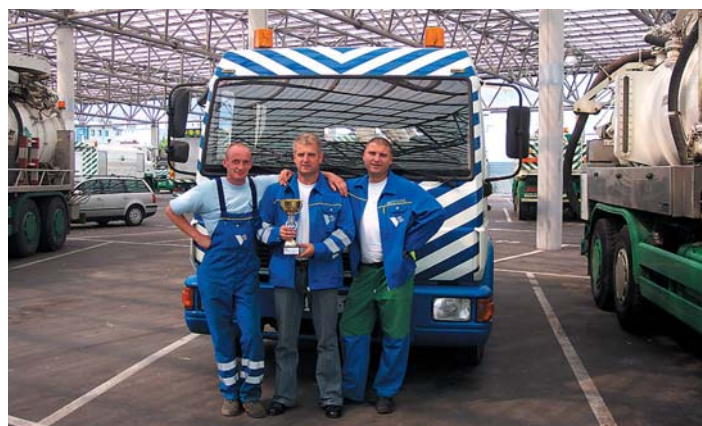
Odlično uigrani monterji podjetja VO-KA.

Za primerno vzdušje na Dnevu suhe robe sta poskrbela harmonikar in zabavni program v