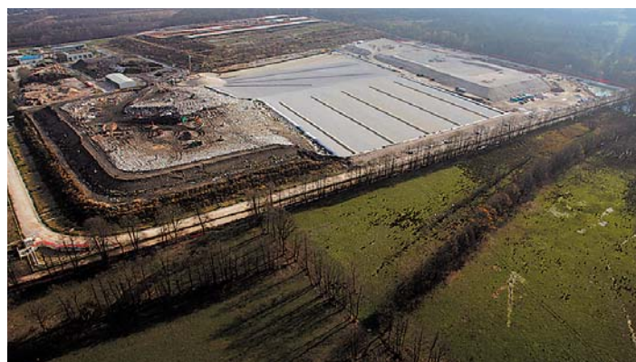
Gradnja četrte in pete faze Odlagališča Barje.

S skrbnim ločevanjem bomo prispevali k ponovni uporabi vseh vrst odpadkov.