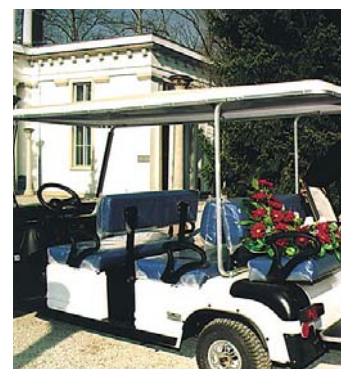
Pogrebno električno vozilo.

Javno podjetje Žale je z julijem posodobilo svojo dejavnost z nakupom električnega vozila, ki je namenjeno prevozu žar ter predvsem prevozu invalidov in slabotnih oseb, ki se udeležujejo pogrebnih slovesnosti. Električno vozilo uporabljajo na centralnem pokopališču Žale.