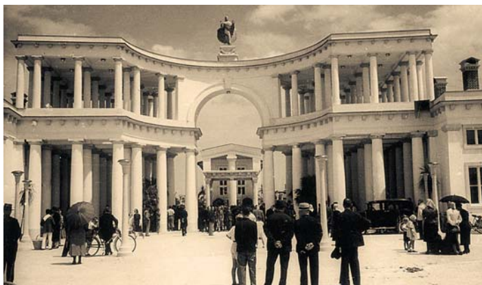
Plečnikove Žale so slovesno odprli leta 1940.

Z načrti kapelic in monumentalnim vhomom, ki daje pokopališču svoj pečat, je znani arhitekt Jože Plečnik začel leta 1938, proces gradnje pa se je zavlekel vse do druge svetovne vojne. Do leta 1940 so dogradili mrtvašnico in molilnico ter 7. julija slovesno odprli Plečnikove Žale ali, kot jih je imenoval arhitekt Plečnik, vrt vseh svetih. Prepoznavnost Plečnikove arhitekture in pokopališča Žale presega okvire Mestne občine Ljubljana. Žale so namreč zaradi svoje bogate kulturne in zgodovinske dediščine pokopališče nacionalnega pomena, edinstvenost in prepoznavnost pokopališča pa presegata tudi slovenske