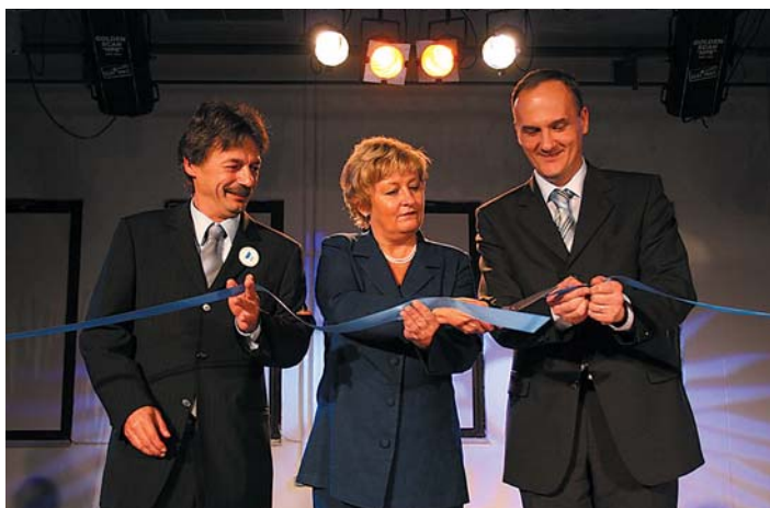
Slavnostno rezanje traku.

Centralna čistilna naprava Ljubljana, ki stoji na zemljišču velikosti 23,8 hektarov, dnevno prečisti v povprečju od 70.000 m 3 do 100.000 m 3 odpadne vode in zadostuje potrebam 360.000 prebivalcev. Čiščenje odpadnih voda traja v povprečju 18 ur, njegov učinek pa znaša od 85 do 95 odstotkov. Pri čiščenju voda kot produkt mehanskega čiščenja letno nastane približno 1.000 ton trdih odpadkov ter približno 8.000 ton posušenega blata, ki se bo do leta 2008 odlagalo na Odlagališču Barje, dolgoročno pa izkoriščalo kot gorivo v predvideni sežigalnici. Vrednost največjega okoljevarstvenega projekta v Sloveniji je znašala 9,724 milijard tolarjev.