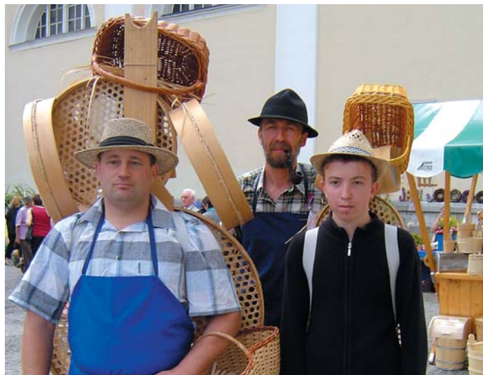
Suha roba obsega široko paleto panog, med njimi krošnjarstvo.

tradicionalna, zato si lahko Dan suhe robe v letu 2006 že sedaj označite na svojem koledarju!