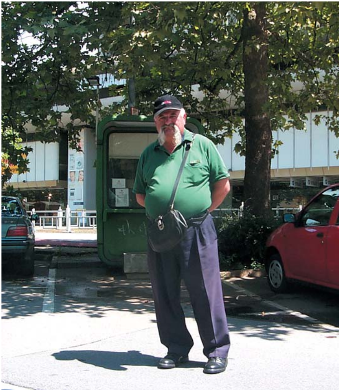
Asfaltno domovanje pred Gospodarskim razstaviščem.