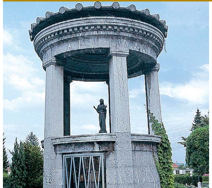
Žale predstavljajo veliko kulturno bogastvo mesta.

okvire. Mednarodno priznanje edinstvenosti podjetju in pokopališču Žale je nedvomno tudi članstvo v Združenju kulturno pomembnih pokopališč v Evropi – ASCE (Association of Significant Cemeteries in Europe).