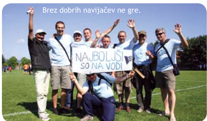
Brez dobrih navijačev ne gre.