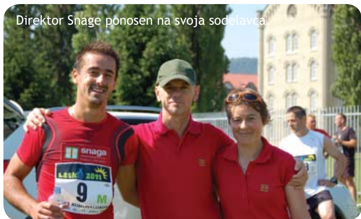
Direktor Snage ponosen na svoja sodelavca.

Drug vikend v juniju je bil za komunalne delavce nekaj posebnega, saj smo se v sončnem Mariboru na 27. Komunalniadi zopet srečali športni navdušenci in ljudje dobre volje. Med več kot 2.500 udeleženci smo se na 10 prizoriščih v različnih delovnih in športnih disciplinah borili tudi člani ekip JP