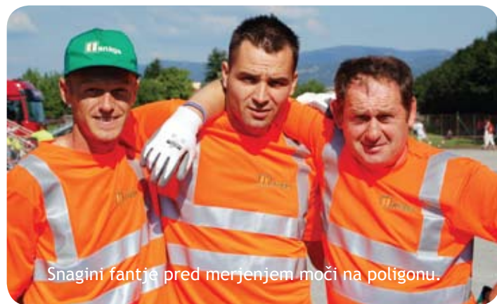
Snagini fantje pred merjenjem moči na poligonu.