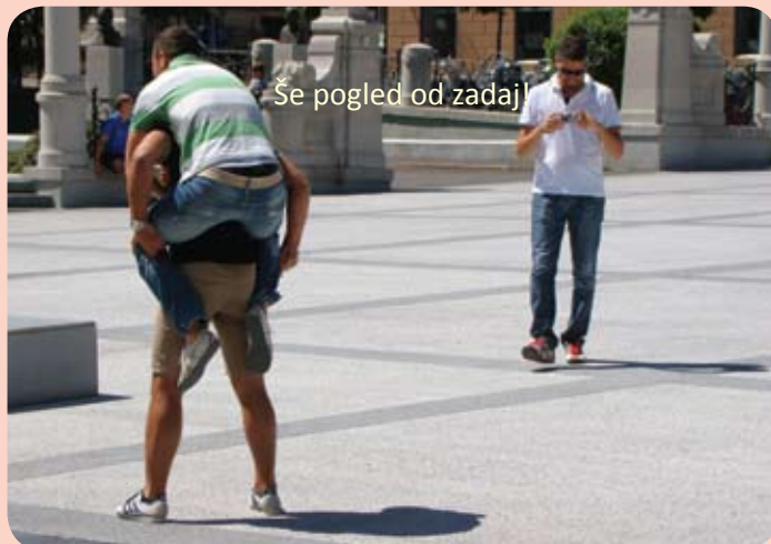
Se pogled od zadaj