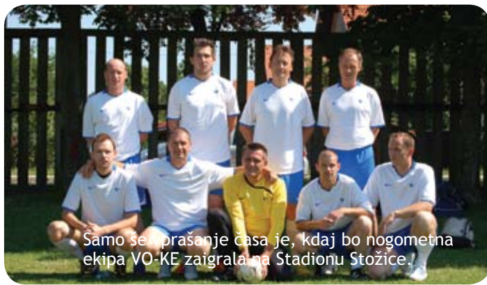
Samo še praznanje časa je, kdaj bo nogometna ekipa VO-KE zaigrala na Stadionu Stožice.