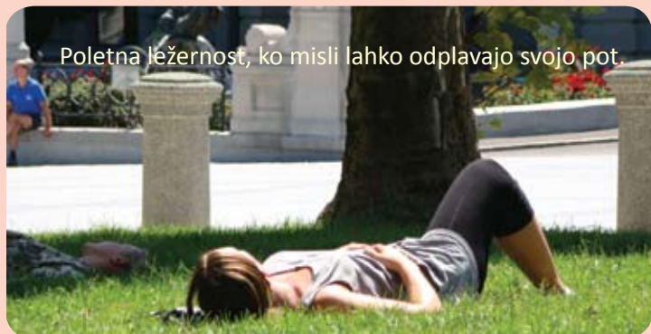
Poletna ležernost, ko misli lahko odplavajo svojo pot.