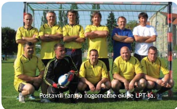
Postavri fantje nogometne ekipe LPT-ja.