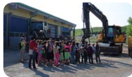
Med ogledom delovnih strojev.

Poleg glavnih objektov smo obiskovalkam in obiskovalcem predstavili tudi vso spremljajočo infrastrukturo, ki je nujno