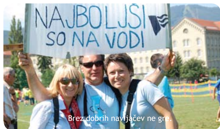
Brez dobrih navijačev ne gre.