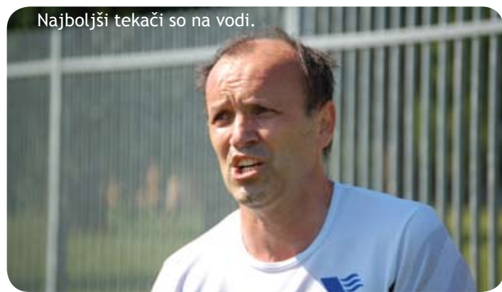
Najboljši tekači so na vodi.