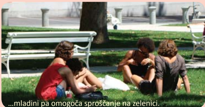
...mladini pa omogoča sproščanje na zelenici.