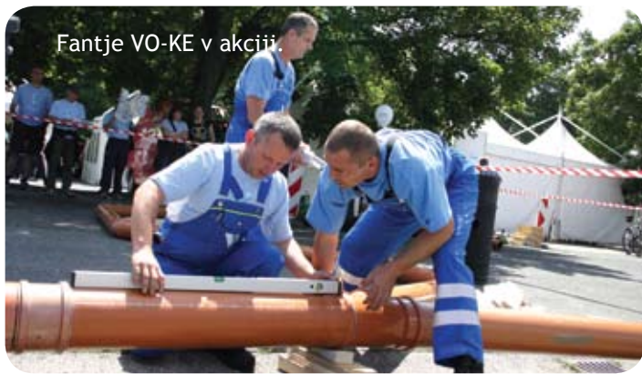
Fantje VO-KE v akciji.