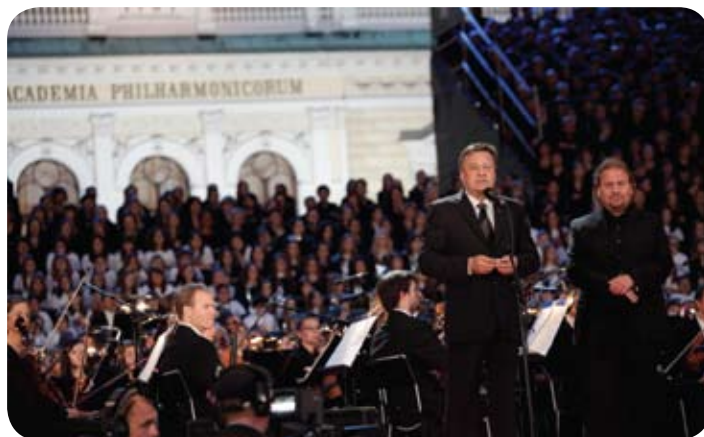
Župan in direktor Festivala Ljubljana sta otvorila 59. Poletni festival.

»Škoda, da letos med gosti ni tistega imenitnega klarinetista. Pa prav zaradi njega sem prišel,« s hudomušnim nasmeškom pravi gost iz Avstrije. Dolgoletni obiskovalec Festivala Ljubljana se je iz sosednje dežele kot mnogo prejšnjih in poznejših večerov pripeljal na kulturno razvajanje v Križanke, za mnoge najbolj čaroben prireditveni prostor v mestu.