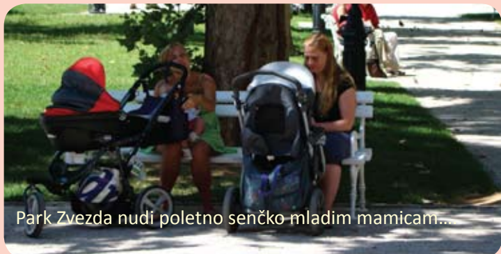
Park Zvezda nudi poletno senčko mladim mamam...