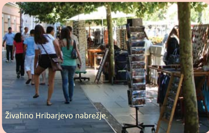
Živahno Hribarjevo nabrežje.