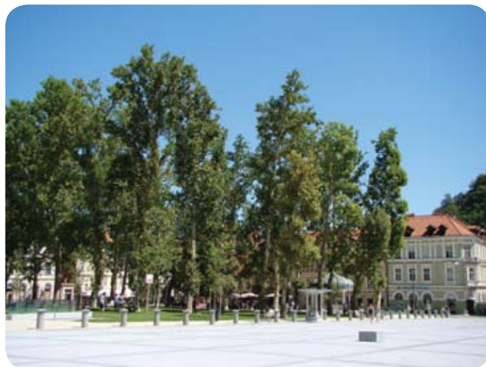
Nova podoba ploščadi Kongresnega trga.