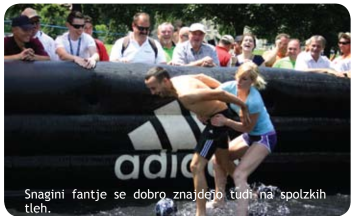
Snagini fantje se dobro znajdejo tudi na spolzkih tleh.