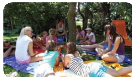
Spoznavanje pod jablo.

Inštitut za družinsko terapijo, svetovanje in izobraževanje ter Javni zavod Mladi zmaji, sta v okviru projekta »Poletna doživetja« organizirala tabor v Moravskih toplicah, katerega se je med čudovitimi prekmurskimi kulisami udeležilo 8 mladostnic.