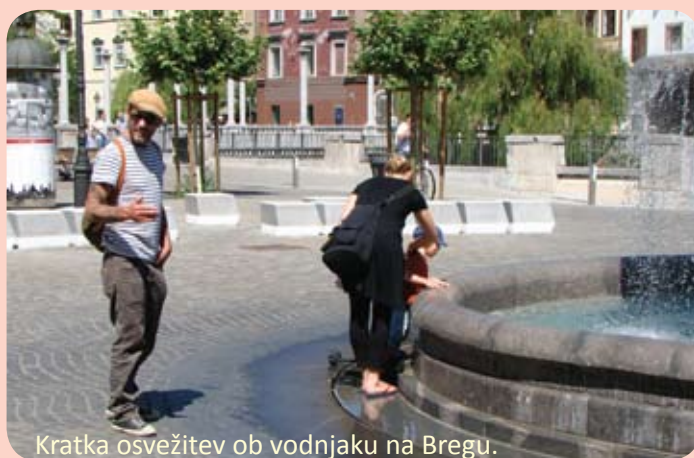
Kratka osvežitev ob vodnjaku na Bregu.