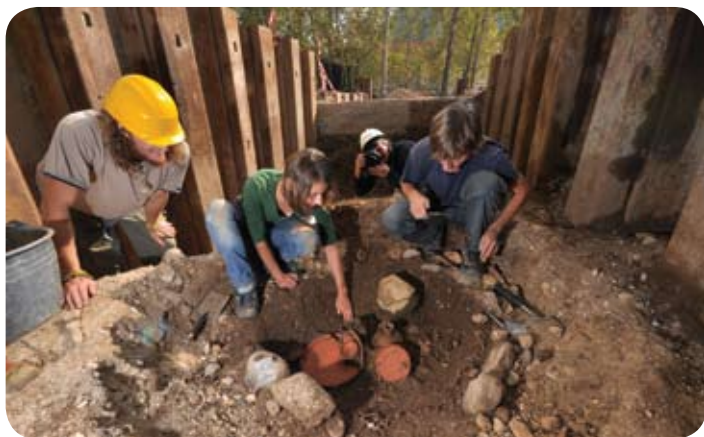
Arheološka izkopavanja so potekala vzporedno z zahtevnimi gradbenimi deli.

Ta projekt obsega izgradnjo garažne hiše s 720 parkirnimi mesti, ureditev obodnih cest - Gosposke, Šubičeve in Slovenske -, preureditev celotne komunalne infrastrukture ter ureditev ploščadi in parka po zahtevah Zavoda za varstvo kulturne dediščine, saj gre za spomenik državnega pomena, Plečnikovo dediščino. Zahteval je predhodne arheološke raziskave na celotnem območju, ki so se začele januarja 2009, ko je bila tudi celotna projektna dokumentacija za garažno hišo pripravljena do faze PGD (projekt za pridobitev gradbenega dovoljenja). Slednjega je izdelalo podjetje IZTR, PGD za prestavitev komunalnih vodov na območju Kongresnega trga, ki ga je bilo treba izvesti pred začetkom gradnje, je naredil LUZ, PGD zunanje ureditve Trga in parka Zvezda