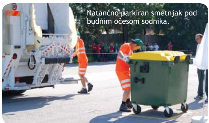
Natančno parkiran smetnjak pod budnim očesom sodnika.