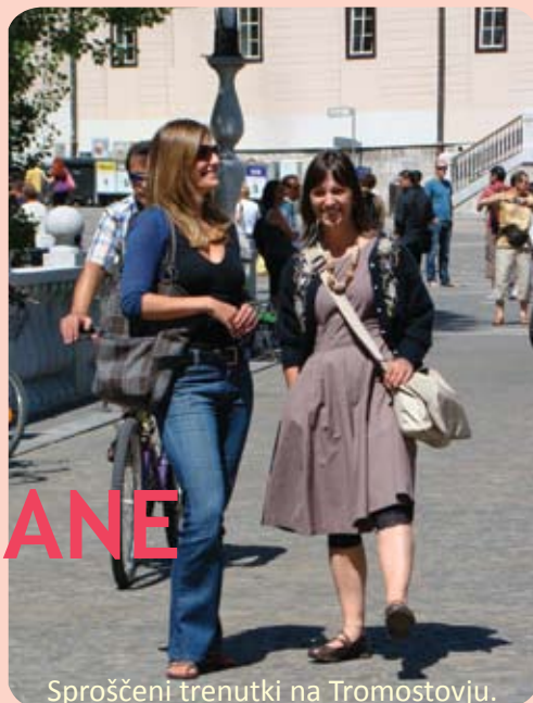
Sproščeni trenutki na Tromostovju.