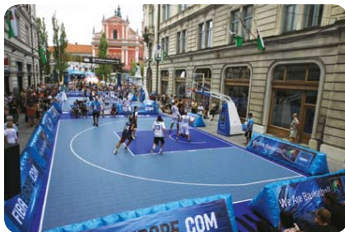
Po končanem dogodku pridejo na prizorišče fantje iz Snage.

» Čiščenje ob in po prireditvah sodelavci Snage običajno izvajajo ponoči oziroma zgodaj zjutraj, ko večina med nami še spi. «