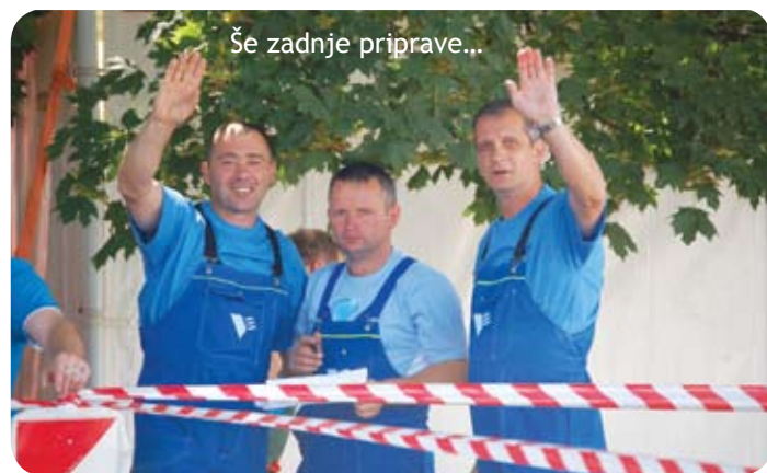
Še zadnje priprave...