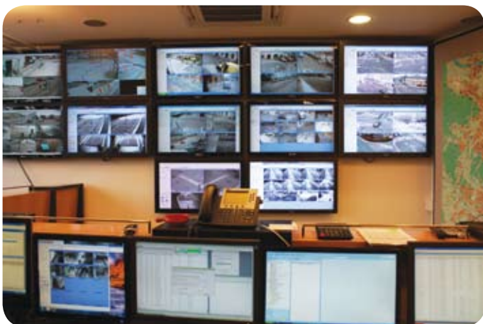
Novi prostori Centra za upravljanje

Na novi lokaciji, upravni stavbi LPP na Celovški 160, v prostorih bivše blagajne, smo združili dosedanja dva Centra za upravljanje. Enega, ki je deloval na lokaciji Tehnološkega parka in je pokrival nadzor nad semaforizacijo, tekočimi stopnicami, potopnimi stebrički, ipd. in drugega, ki je deloval na Cesti dveh cesarjev, na območju avtosejma, preko katerega smo upravljali javne parkirne površine.