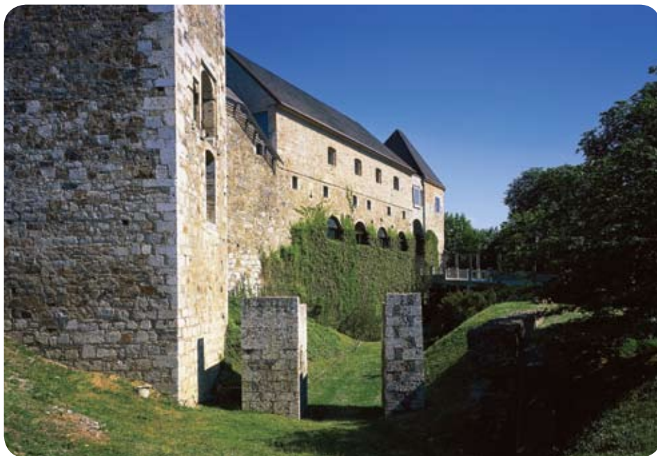
Ljubljanski grad