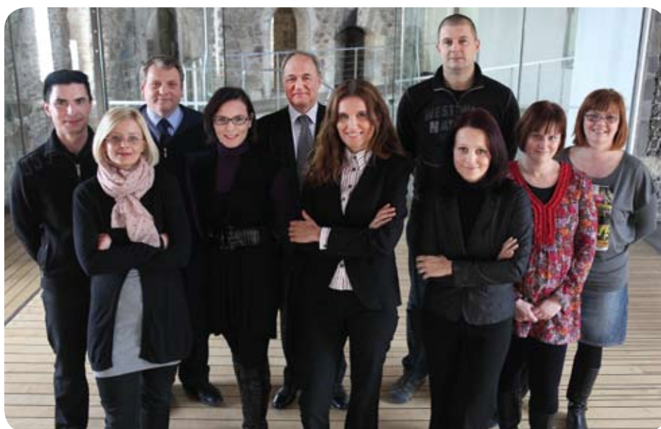
Grajska ekipa