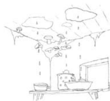
Avtor ilustracije: Jure Simič

Zdaj nas čaka nekaj mesecev trdega dela pri obdelavi vlog, pošiljanju pozivov za dopolnitev (v zadnjih dneh so prosilci »lovili« razpisni rok in so oddajali vloge brez prilog, s katerimi utemeljujejo posamezne kategorije, kot je stanovanjski status, zdravstvene razmere...), ogledih stanovanjskih razmer, obdelavi pritožb ... jeseni 2011 naj bi že vseljevali nove najemnike. Ob tekočem delu bo to poseben napor, ki bo terjal dodatne delovne napore v popoldanskem času in ob vikendih, kateri naj bi bili sicer namenjeni počitku in obnavljanju energije. Toda vse delovne napore bomo zmogli z nasmeškom na obrazu, saj imamo nekaj, kar je zlata vredno: primerno delovno vzdušje zahvaljujoč dobremu medsebojnemu sodelovanju in odličnemu vodstvu. In še z užitek bomo pojedli tortice, ki jih bo plačal napovedovalec stave z najmanjšim številom vlog !