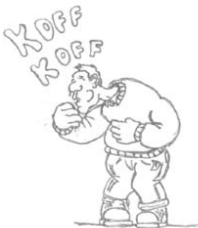
Avtor ilustracije: Jure Simič

V roku okvirno 6 mesecev bomo pripravili prednostno listo vseh upravičencev in individualne akte o (ne)uvrstitvi. Po pritožbenem postopku (okvirno 3 mese-