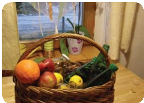
Po nakupih s košaro

Ločevanje komunalnih odpadkov se prične že v trgovini. Izbirajte izdelke s čim manj embalaže oziroma takšno, ki jo lahko recikliramo (papir, steklo, okolju prijazna plastika). Pametna izbira so tudi izdelki v embalaži, ki omogoča ponovno polnjenje. Po nakupih pojdite s košaro ali platneno vrečko, da vam ne bo treba kupovati plastičnih vrečk. Izogibajte se veliki embalaži, ki jo ne boste mogli oddati v zabojnik za embalažo.