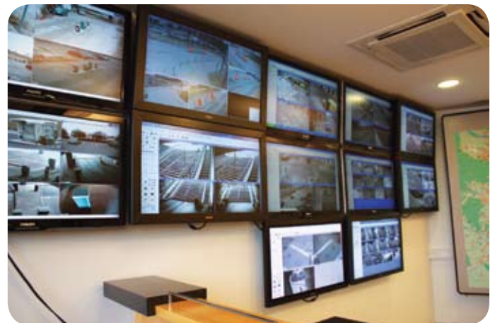
Novi prostori Centra za upravljanje

Z uporabo sodobnih tehnologij širokopasovnih povezav in brezžičnega prenosa podatkov lahko zagotavljamo boljši nadzor nad sistemi, hitrejše posredovanje servisnih ekip za odpravo napak in tako zagotavljati boljšo varnost udeležencem v prometu.