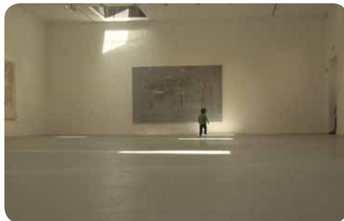
Pot k svetlobi

in počez našo prijetno stavbo, prijazno, diskretno in nevsiljivo umeščeno v stanovanjski soseski, med bloke in vrtce in šole, in