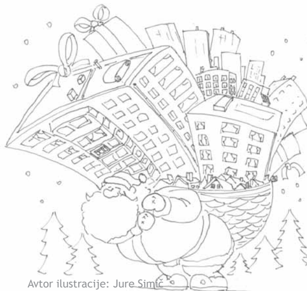
Avtor ilustracije: Jure Simić

Javni stanovanjski sklad MOL // Jožka Hegler, direktorica // Zarnikova ulica 3 // Telefon: 01 306 14 36 // jss.mol@ljubljan.si // www.jssmol.si