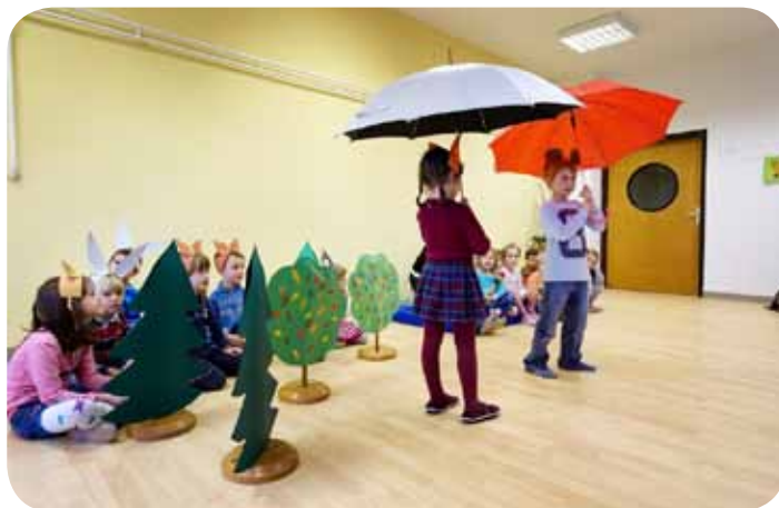
Vrtec Ciciban // odprtje enote Pastirček

žali novo pokojninsko reformo, da bomo uspešni in kompetentni, predvsem pa, da bomo pravično nagrajeni za uspešno delo in obogatitvene dejavnosti, ki jih z velikim veseljem izvajajo naše strokovne delavke.