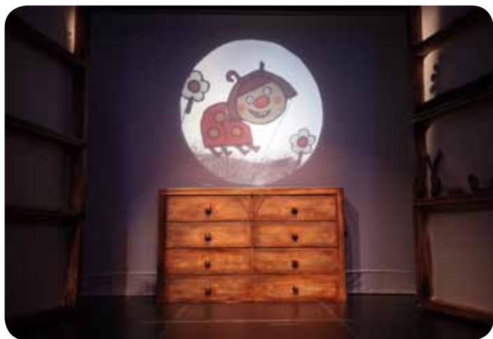
Male živali, Lutkovno gledališče Ljubljana

LGL//17:00, Kulturnica (Židovska steza 1)//J. Kuntner: MAVRICA, dramska predstava za otroke od 2. leta dalje