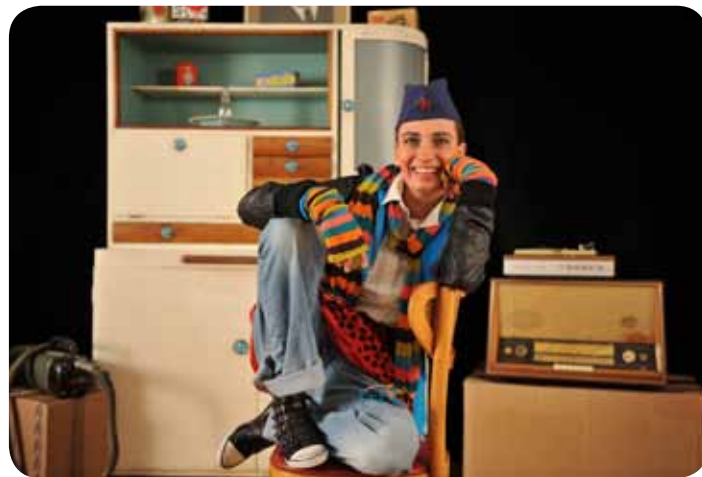
Pink, Lutkovno gledališče Ljubljana

LGL//11:00 , Mali oder LGL//J. Malik: ŽOGICA MAROGICA, lutkovna predstava za otroke od 3. leta dalje LGL//17:00 , Mali oder LGL//J. Malik: ŽOGICA MAROGICA, lutkovna predstava za otroke od 3. leta dalje SMG//19:00 , Spodnja dvorana SMG//LJUBEZEN NA SMRT, Koncert za kuharja, šest vajencev in tri pomivalce MGL//19:30 , Veliki oder MGL//P. Stone, J. Styne, B. Merrill: SUGAR - NEKATERI SO ZA VROČE, mjuzikel