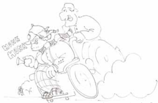
Avtor ilustracije: Jure Simič

Prihajajoča zima bo gotovo tudi letos s seboj prinesla gripo in druga prehladna obolenja. Poskrbeli bomo, da se pred to nadlogo ustrezno zaščitimo, Tebe pa prosimo, da nam po Tvojih močeh pomagaš čuvati zdravje vseh zaposlenih in naših uporabnikov.