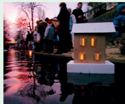
Gregorčki na Gradaščnici

la, saj je ena od najbolj prisrčnih prireditev v letu, ki razveseljuje ne le najmlajše, temveč tudi njihove starše, pa tudi dedke in babice. Kot že nekaj let zapored, je tudi letos izvajalec te prireditve Staroljubljansko društvo. Glasbeni nastopi bodo potekali na mostičku čez Gradaščico, celotno prizorišče ob Gradaščici bo rahlo ozvočeno in osvetljeno.