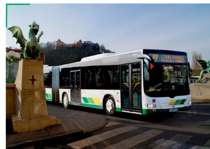
Mestni potniški promet ostaja v JP LPP, v posebno podjetje pa se bo izčlenila dejavnost službe PPP.

novitvi nove družbe in njenem vpisu v sodni register bodo vsi zaposleni, ki bodo prešli na novo družbo, pravice in obveznosti iz svojih pogodb o zaposlitvi ohranili še dve leti. V nadaljevanju je načrtovana prodaja nove družbe. Razpis za prodajo Bus, d.o.o., naj bi objavili še v letošnjem letu, pri čemer bosta odločilna kriterija ponujena cena in ohranitev delovnih mest.