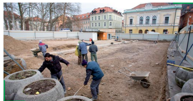
Na Kongresnem trgu, pod katerim bo zgrajena garažna hiša, zdaj arheologi izkopavajo ostanke antične Emone.

Garažna hiša pod Kongresnim trgom z dimenzijami 147,50 m x 27,95 m bo segala 17 metrov pod zemljo in bo imela 5 etaž, v katerih bo 730 parkirnih mest. Nova ureditev ploščadi Kongresnega trga bo sledila prvotni Plečnikovovi zamisli z rasterskim tlakom in linijo kandelaberskih luči vzdolž trga.