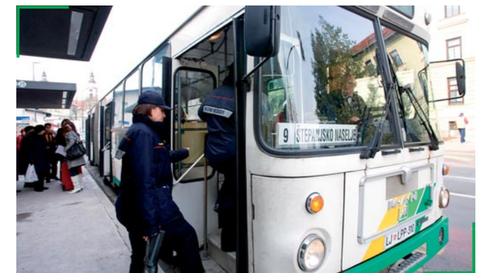
Nadzor nad napačno parkiranimi vozili na postajališčih mestnih avtobusov bodo mestni redarji v sodelovanju z LPP izvajali tudi v prihodnje.