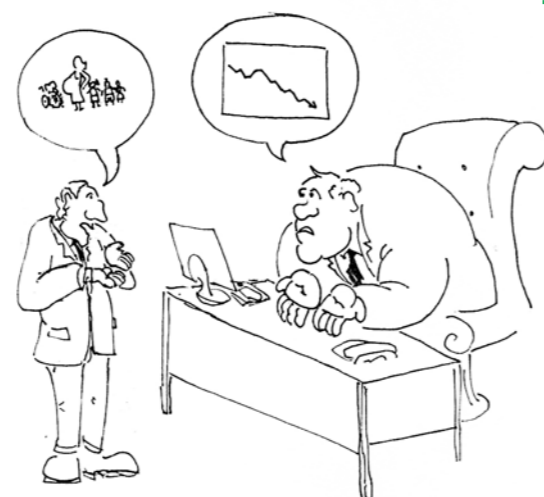
avtor: Jure Simič, JSS MOL

Vloga nadrejenega je v razgovoru zelo pomembna, saj mora iz razgovora potegniti, kaj zaposlenega motivira, kaj vpliva nanj, da morda reagira destruktivno, kaj ga vodi k največji učinkovitosti, saj bo le tako dosegel, da bo delovni proces najbolj učinkovit. Pri pripravi na razgovor naj razmišljanje poteka predvsem o projektih in delovnih procesih v katere je bil delavec vključen, v katerih je kreativno sodeloval. Izpostaviti pa je potrebno predvsem kritične dogodke, ko se zaposleni ni obnašal tako kot običajno (lahko pozitivno ali negativno) in je to delovanje vplivalo na formalne ali funkcionalne spremembe v podjetju. Torej glavni namen letnega razgovora je, da vodja preko jasno prikazane delovne učinkovitosti zaposlenega pove, kako bi rezultate še izboljšal in mu da vedeti, kaj delodajalec od njega pričakuje.