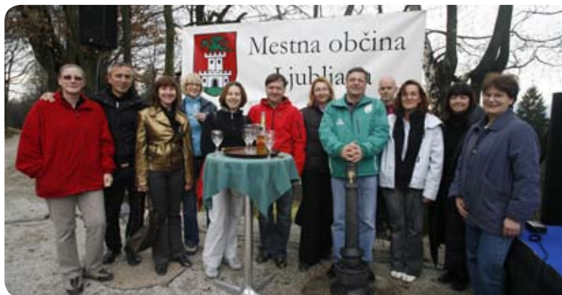
Prisotni na Rožniku: Zaposleni iz Kabineta župana, Službe za razvojne projekte in investicije, Snage, JP Vodovod-Kanalizacija in JHL

obiska zadostili potrebi po stalni dobavi pitne vode in zagotovili požarno varnost, je MOL pristopila k aktivnostim za izgradnjo vodovoda. Služba za razvojne projekte in investicije MOL je po projektu podjetja Hidroinženiring financirala postavitve fontane ter izgradnjo novega vodovoda z objektom prečrpalnice, ki je priključen na ljubljanski centralni vodovodni sistem. Trasa vodovoda, dimenzije DN 100 in dolžine 966 metrov, poteka po obstoječi poti na Cankarjev vrh. Prečrpalnica omogoča dvig tlaka in zagotavlja požarno varnost tudi obstoječemu vodovodnemu omrežju v smeri Drenikovega vrha. Vrednost celotne investicije znaša 280 tisoč EUR.