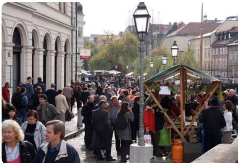
Ljubljanska vinska pot je pritegnila množico ljubiteljev vina in kulinarike.