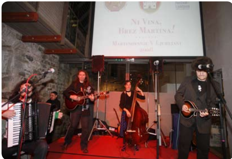
Martinovanje na Ljubljanskem gradu je popestrila priznana skupina Terrafolk.