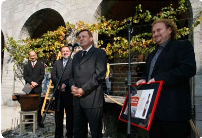
Župan Zoran Jankovič je pozdravil goste na trgatvi Ljubljanske mestne trte.

Nekaj dni prej, natančneje 8. novembra, pa smo martinovali na mestnih ulicah, po katerih se je vila Ljubljanska vinska pot, prireditve, ki jo je omogočil Zavod za turizem Ljubljana. Na 48 razstavnih mestih na obrežjih Ljubljanice in v starem mestnem jedru se je predstavilo preko 80 slovenskih vinarjev, ljubljanskih gostincev in proizvajalcev kulinaričnih dobrot. Obiskovalci so lahko spoznavali okuse vseh treh slovenskih vinorodnih dežel Primorske, Podravja in Posavja ter pokušali različna mlada in druga vina, značilna za posamezen okoliš. Zraven so uživali ob suhomesnatih in mlečnih izdelkih, praženem krompirju, bograču in drugih domačih dobrotah z različnih kmetij, dogajanje pa so popestrili nastopi glasbenih in folklornih skupin iz vse Slovenije. Na praznik, ko se je mošt spremenil v vino, je tako tudi prestolnica zaživela v vzdušju slovenskih vinorodnih dežel in vinskih cest, njihovih vin, kulinarike in kulture. K temu je pomembno prispeval tudi 11. Slovenski festival vin, ki je od 19. do 21. novembra potekal v Hotelu Slon, kjer so lahko obiskovalci – bilo jih je več kot 1500 - izbirali in poskušali preko 600 vzorcev vin.